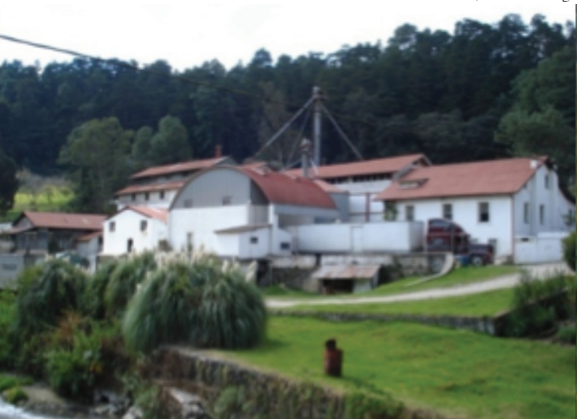
Beneficio de café Helvetia, Chimaltenango