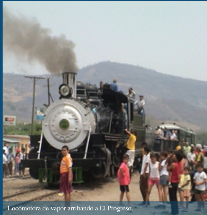
Locomotora de vapor arribando a El Progreso.

Programa de estudios en patrimonio cultural