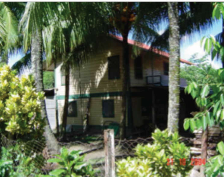
Vivienda bifamiliar, finca Chicasaw, Izabal

Se elaboraron fichas de registro que consignan la localización de las edificaciones, estado de conservación con mapas y planos arquitectónicos.