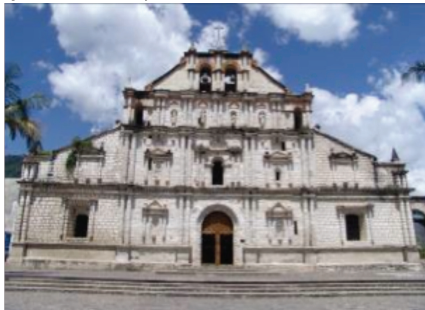
Iglesia de San Francisco, Panajachel, Sololá

Hasta la fecha, el segmento establecido es el de la región oriental del país, donde ya se cuenta con los guiones museográficos correspondientes y se ha promocionado como ruta cultural. El resto de segmentos está en proceso, exceptuando el de la ciudad de Antigua Guatemala, que es impulsado diariamente por los tour operadores.