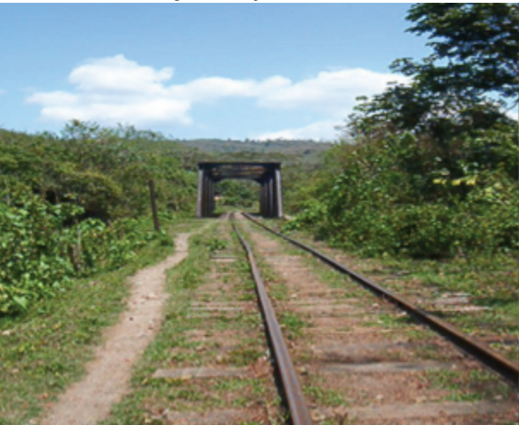
Tramo de El Progreso a Zacapa