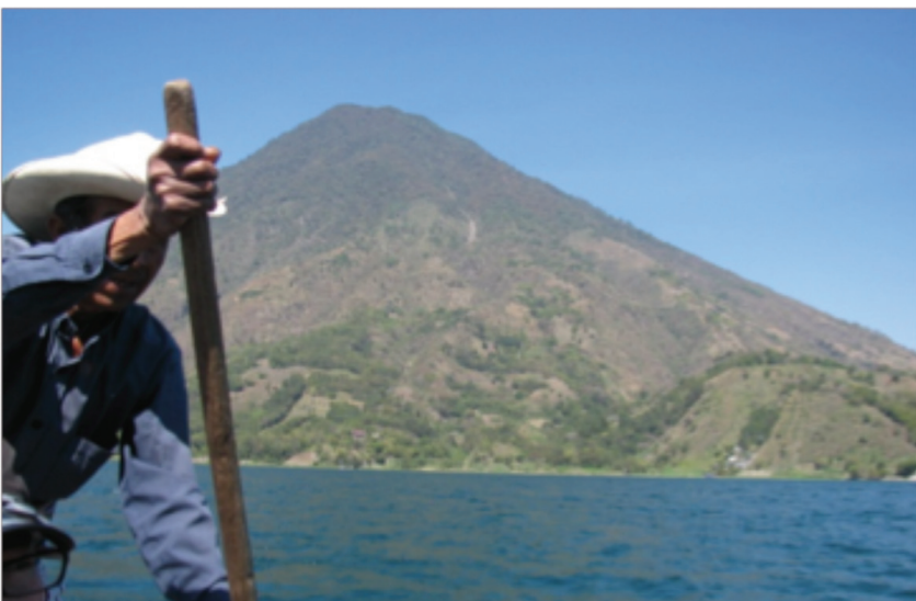
Pescador. Al fondo volcán San Pedro.