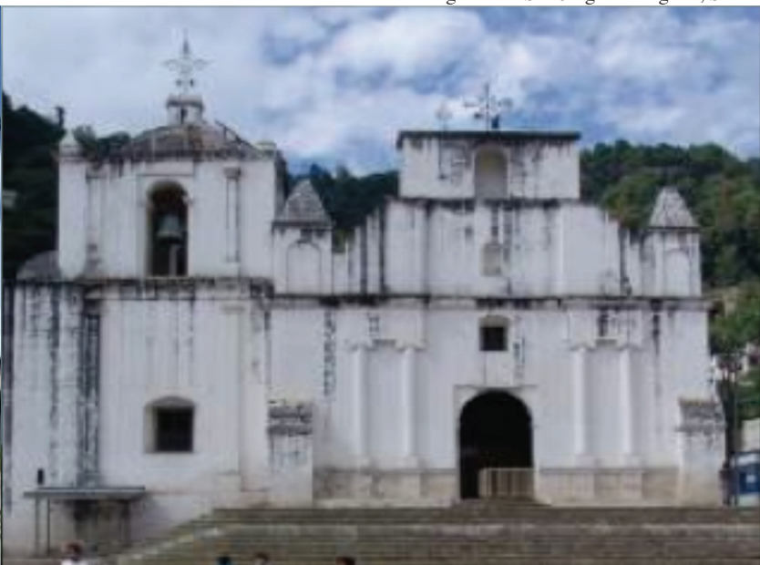
Iglesia de San Jorge La Laguna, Sololá