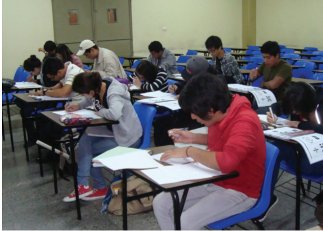
Estudiantes de Fundamentos del Diseño sección D1, 2013.