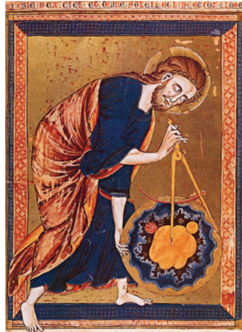
Ilustración 3 Dios Geómetra 12

Estos sistemas de proporción se transmitían por tradición oral, en la ya mencionada Geometría fabrorum, ejemplos de ello se encuentran también en época renacentista, en el tratado manuscrito del quattrociento de Francesco di Giorgio Martini, catalogado como II.I.141 del Fondo Nazionale, albergado en la Biblioteca Nazionale Centrale di Firenze (BNCF)