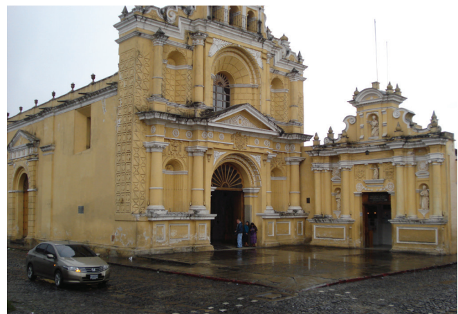
Figura 5: Hospital San Pedro Apóstol. Hoy obras sociales del Hermano Pedro. (2013)