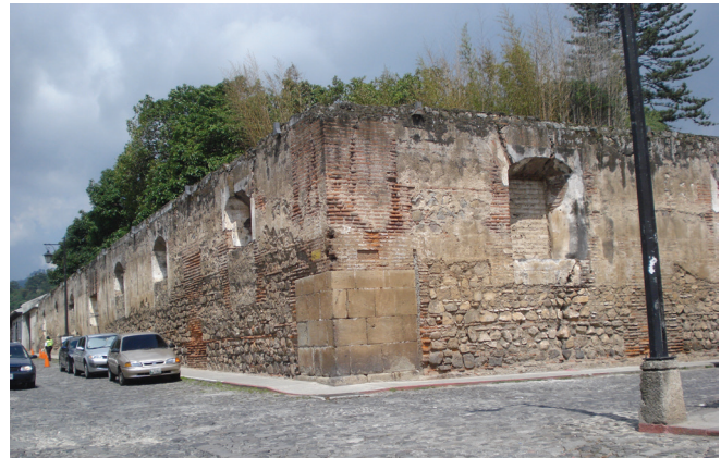
Figura 4: Hospital Real de Santiago.(2013) Antigua Guatemala.