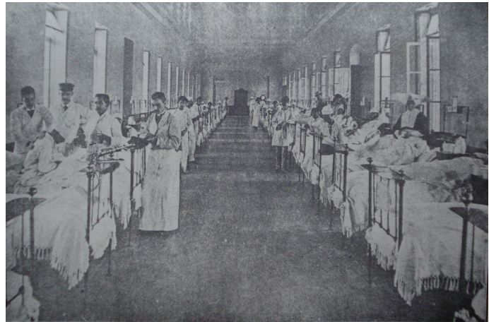
Figura 1: Sala de cirugía, Hospital General San Juan de Dios (1902) notese el altar al fondo y la similitud con los arreglos espaciales coloniales, mejorando las condiciones sanitarias. Fuente: Francisco Asturias, Historia de la Medicina en Guatemala.

Puede hacerse mención que ilustraciones europeas del siglo XV 9 muestran a dos personas ocupando una cama, el