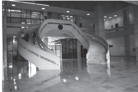
Fotografía No.2 Módulo de Gradas en Vestíbulo del Palacio de Justicia. Guatemala, 2013.

tante, su importancia simbólica limita entre otros aspectos funcionales, la circulación y ruta de evacuación. Los Muros del Palacio y Torre de Tribunales, construidos en ladrillo de barro tayuyo 11 sirven como tabiques divisorios. En tanto la estructura portante que utilizó un sistema constructivo innovador para la época (concreto armado, losas reticuladas, capiteles y vigas planas) es similar a la utilizada en el edificio del Banco de Guatemala.