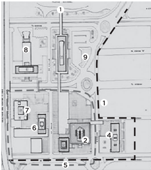
Gráfico No. 2 Contexto actual del Complejo Judicial,