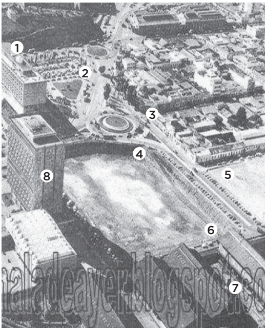
Gráfico No. 1 Terreno de la Penitenciaría y su contexto.

El conjunto de arquitectura judicial guatemalteco es considerado como el de mayor representatividad por su importancia político-administrativa y jurisdiccional, que se integra físicamente por los edificios de la Corte Suprema de Justicia o Palacio de Justicia y la Torre de Tribunales, ambos ubicados en el Centro Cívico de la ciudad de Guatemala, uno de los sectores urbanos de mayor jerarquía en la obra pública de uso administrativo. Su diseño original se destinó para albergar la sede del poder judicial en su parte administrativa y jurisdiccional el cual se ha conservado hasta la actualidad.