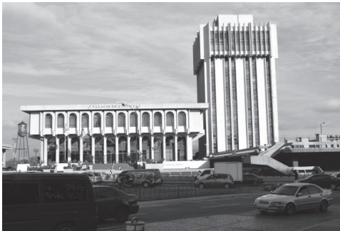
Fotografía No. 1 Conjunto de edificios del Organismo Judicial en la ciudad de Guatemala. El Palacio de Justicia con arcada en la fachada, al costado la torre de Tribunales.

Contexto urbano de la actual sede del Organismo Judicial. El conjunto de edificios judiciales se construyó en una fracción del terreno que ocupó la antigua Penitenciaría de Guatemala 7 (demolida aproximadamente en el año 1968), lugar que también es ocupado por los edificios del Banco de Guatemala y Crédito Hipotecario Nacional. Inicialmente fue denominado (1975) como el Edificio de la Sede de Tribunales; sin embargo, siendo su apelativo actual «Palacio de Justicia», popularmente se conoce como la Corte Suprema de Justicia y Torre de Tribunales. Su configuración espacial dentro del terreno que ocupa se enmarca por dos plazas públicas que delimitan ambas construcciones, la principal que se ubica en la 7ª. Avenida de la zona 1, denominada «Plaza de los Derechos del Hombre» y la segunda situada sobre la 9ª. Avenida de la zona 1, media entre el conjunto judicial y las instalaciones de Ferrocarriles de Guatemala (FEGUA).