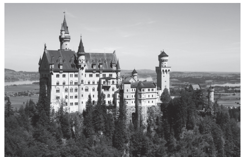
El Castillo de Neuschwanstein, en Schwangau, Baviera (Alemania). Concluido en 1886, obra del rey Luis II de Baviera, de estilo historicista con mayor influencia medievalista emplazado dentro de un paisaje natural con vistas escénicas. Su expresión arquitectónica posee elementos fantásticos que han despertado la admiración del público de masas.

por la Edad Media dio pie a la conservación y la restauración de los monumentos arquitectónicos medievales. Aunque esto limitaba la propia libertad y la espontaneidad creativas que promovió el propio Romanticismo por la obra restauradora, pero salvo a muchos de esos monumentos de la destrucción, particularmente con la movilización que encabezó Viollet-le-Duc. Dando inicio al movimiento conservacionista internacional que ha logrado salvar y preservar a muchas obras y sitios de valor patrimonial. A la vez, con la revalorización de lo gótico, por su impecable lógica estructural, su bella esbeltez y delicadas decoraciones, así como por el manejo de penumbras con la luz cenital, entonces devino la emulación del mismo como estilo para el mundo moderno, es decir aquí el Romanticismo cayó en un conformismo y convencionalismo, por ejemplo las nuevas iglesias se hicieron enteramente góticas. Dentro de este Romanticismo convencional se realizaron obras como el Castillo de Pierrefonds reedificado por Viollet-le-Duc o los castillos fantásticos de Luis II de Baviera, cuyas formas casi fantásticas y emplazamientos escénicos, atrajeron el interés del incipiente turismo de masas y luego de la emergente industria cultural.