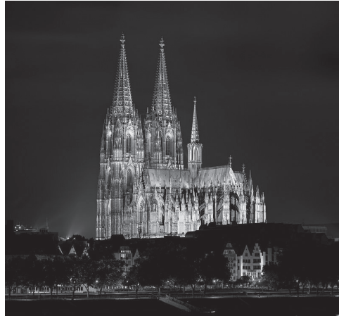
La Catedral de Colonia, Alemania. Iniciada en el siglo XIII pero que quedó inconclusa a inicios del siglo XVI, fue hasta mediados del siglo XIX por intervención de varios personajes del romanticismo que se logró retomar su conclusión, fue inaugurada en 1880. Es uno de los primeros y más conocidos casos de valoración de arquitectura del pasado, parte del movimiento de salvaguarda de edificaciones antiguas que derivaría en la creación del campo profesional de la conservación y restauración, que ha logrado proteger y valorar a muchos bienes inmuebles de valor patrimonial alrededor del mundo. Fotografía a color de Thomas Wolf, agosto de 2013. De dominio público.

El Romanticismo propugnó por un pluralismo cultural de los estilos históricos y exóticos, en vez del supuesto modelo universal