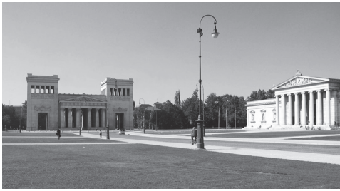
Vista parcial de la Königsplatz de Múnich (Plaza del rey), con la introducción de obras arquitectónicas con cierta singularidad pero sin romper la unidad del conjunto, el Romanticismo deseaba superar la homogeneidad excesiva en los lugares urbanos.