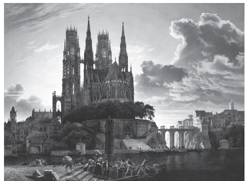
Ciudad medieval con río, pintura del arquitecto alemán Karl F. Schinkel, realizada a inicios del siglo XIX. Esta imagen artística encarna varios de los ideales de la arquitectura del romanticismo, principalmente la intensidad religiosa y la admiración por el Medioevo, en particular las catedrales góticas. La fotografía es de la Web Gallery of art y es de dominio público.

consiguientemente el nuevo ideal artístico se encontraba en una nueva Edad de oro, que era la Edad Media. Un seguidor suyo Novalis, llegó a presentar al Medioevo como la semilla germinal de la cultura europea, de ahí la importancia de emprender su estudio histórico. 15 Ya a inicios del siglo XIX, el alemán Friedrich Schlegel llevó la nueva voluntad artística a la esfera de lo místico, de ahí que los términos clave de sus apreciaciones pasaron a ser: aparición, arrebató, iluminación, éxtasis amoroso, belleza interior, entre otros. 16 Schlegel junto a Schiller, sostuvieron que se trataba de no imitar la perfección de las obras de otras épocas sino de superar su grandeza, por vías absolutamente incomparables y en relación con el sentir y pensar de aquel mundo moderno. 17