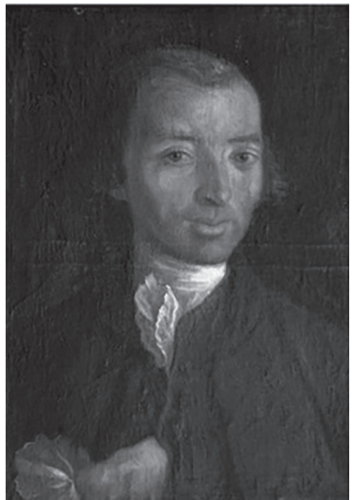
Figura No. 1 Retrato de Marcos Ibáñez por D. Mariano Maella Pintor del Rey.

El arquitecto de Carlos III, Francisco Sabatini, le había encargado a Ibáñez, apoyo en varios trabajos, entre estos el palacio del Pardo, donde trabajaba antes de recibir la orden de trasladarse a Guatemala. Se le ofrecieron muchas cosas, pocas le cumplieron, pero tan solo el ofrecimiento de diseñar una ciudad y trascender en el tiempo, ya es algo atractivo para un arquitecto, por lo que Ibáñez cruzó el mar para diseñar la ciudad de Guatemala.