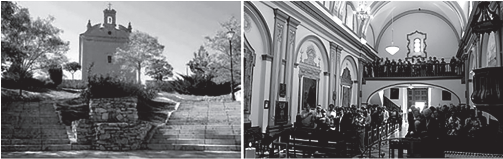
Figura No. 2 Ermita de la Virgen de las Mercedes o de la Cuesta, diseñada por Marcos Ibáñez. Fuente de Imagen: http://www.diocesisdeteruel.org/noticiasodonmerced12.html y http://www.clubrural.com/pueblos/teruel/odon/fotos?idfoto=12130 , 2 de noviembre 2015. Camio de color y diagramación kch. Noviembre 2015

En la parte de atrás de este mismo documento se indica que el 16 de octubre de 1783, unos pocos días antes de marcharse de vuelta a España, vendió su casa a Don Diego Peinado, en 5550 pesos, pagando de su cuenta, el costo de la escritura y alcabala que fue de 223 pesos. 7 Asunto por el cual la casa de Ibáñez pasa a manos de Peinado quien murió en 1789, seis años después.