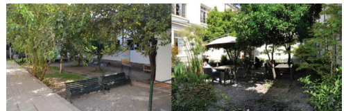
Figura 10: Jardín de los Naranjos, Hospital del Salvador antes y después de su recuperación.

A nivel internacional los jardines están siendo tomados en cuenta tanto para la revitalización de hospitales ya construidos como se observa en la Figura 10 o como parte de nuevos proyectos como el Centro de Cuidados de Cáncer Maggie en Yorkshire, en Inglaterra diseñado por Thomas Heatherwick visto en la Figura 11.