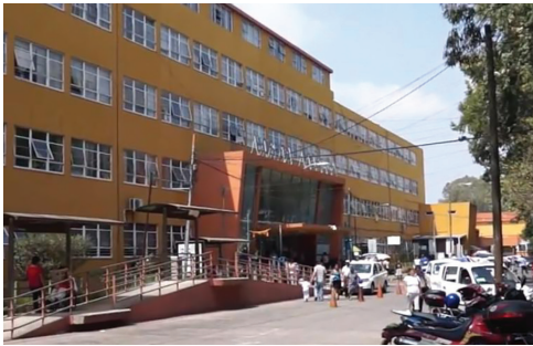
Figura 2: Hospital Roosevelt, Guatemala. Fuente: http://d5pa5brvrabv4.cloudfront.net (Marzo 2016)

Pero este no es un problema actual, si nos remontamos a los Hospitales del Siglo XX se puede observar en la Figura 3 como las edificaciones contaban con largos pasillos en donde apilaban camas y que se traducían en fachadas largas sin jardines como se aprecia en la Figura 4. De acuerdo con algunos archivos del Hospital General del Ministerio de Salud Pública y Asistencia Social después de los terremotos de Santa Marta, en 1773-74, el Hospital San Juan de Dios funcionó en dos casas improvisadas, una en lo que hoy se conoce como Parroquia Vieja y la otra en los alrededores de su ubicación actual. Posteriormente «se edificó en una de las partes más altas de la ciudad