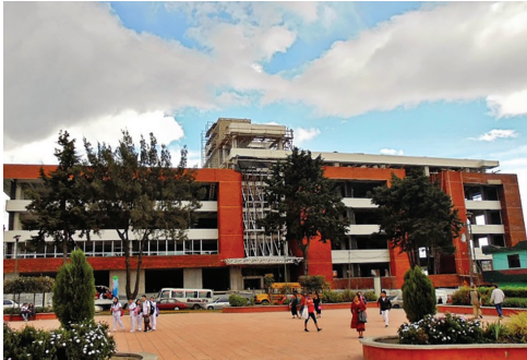
Figura 1: Centro Hospitalario La Paz, Quetzaltenango.

de el área verde es parte importante de un hospital privado y en la Figura 2 esta no tiene gran relevancia o importancia dentro de un hospital público.