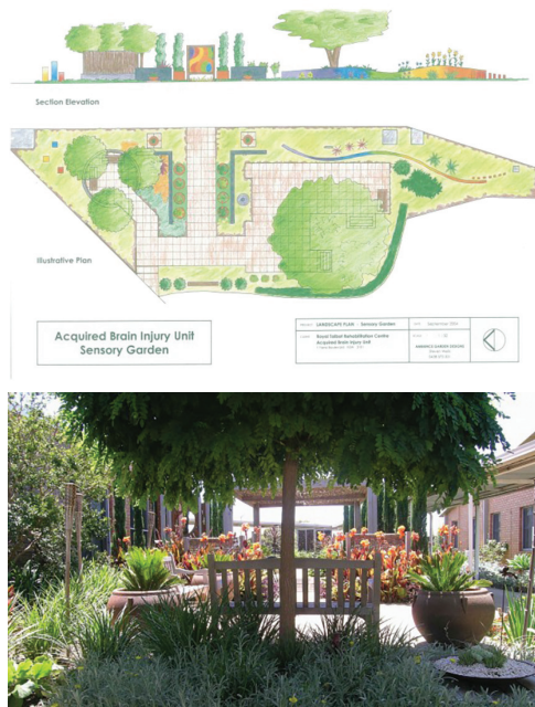
Figura 14: Jardín sensorial del Royal Talbot Rehabilitation Centre

Teniendo en cuenta toda esta base teórica y científica surge una pregunta esencial: ¿Es posible considerar los jardines de sensaciones como una potencial opción para ser utilizados en los hospitales de Guatemala? Si bien es cierto que son jardines bastante nuevos dentro de los jardines terapéuticos y no es algo muy común a nivel internacional, ya que es más común la utilización de otros tipos de jardines terapéuticos como los de contemplación, restaurativos y de rehabilitación, se convierten en una opción muy práctica ya que al tener un enfoque mucho más sensorial pueden ser apreciados desde las ventanas de los hospitales o como parte del proceso de rehabilitación de pacientes inclusive como un jardín de juegos para niños cuyos padecimientos provocan que deban pasar mucho tiempo en los hospitales alejados de sus familias.