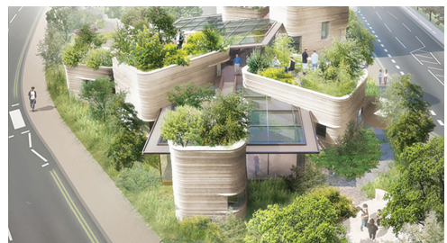
Figura 11: Centro de Cuidados de Cáncer Maggie en Yorkshire, en Inglaterra. Abril 2017