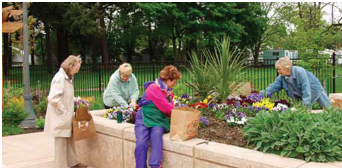
Figura 13: Jardín en Portland (terapéutico)