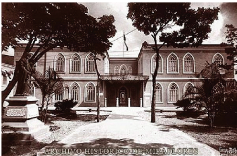
Figura 8: Hospital Dr. José María Vargas de Caracas, Venezuela 1888-1891.

Pero todo esto se pierde en los hospitales occidentales a partir del Siglo XX, cuando se da paso a la construcción de edificios más sofisticados haciendo uso de nuevas tecnologías y cuyo objetivo principal es reducir riesgos de infección dejando en segundo plano el aspecto emocional de los pacientes recluidos en ellos, se toma como estilo constructivo el «Internacional Style». 5 Pero es gracias a Florence Nightingale (1820-1910) la cual defiende la higiene y es la primera en usar un método científico y estadístico para la atención de los pacientes; que en los Hospitales ingleses se hacen reformas retomando los jardines con flores, dormitorios con iluminación y ventilación natural además de que las camas se colocan cerca de las ventanas.