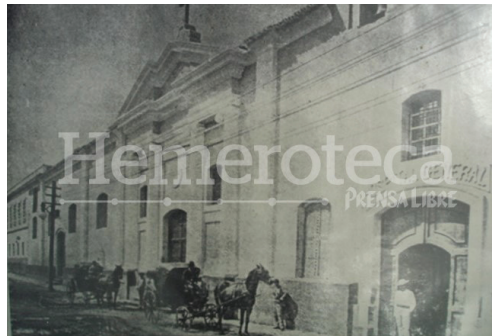
Figura 4: Fachada del Hospital General San Juan de Dios antes de los terremotos de 1917 - 18.