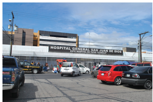
Figura 5: Hospital General San Juan de Dios actualmente.