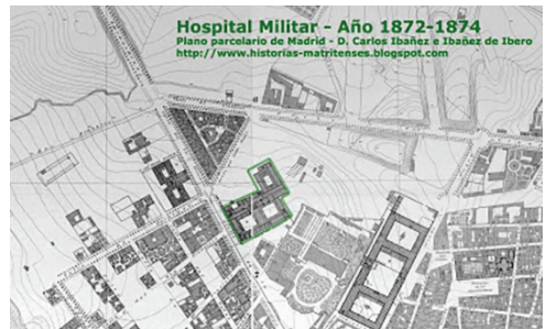
Figura 9: Hospital Central de la Defensa "Gómez Ulla" Madrid, España 1872-1874.

llos balcones y terrazas desaparecieron, y los jardines que rodeaban la edificación han sucumbido a las plazas de parqueo. Lo que convierte a los hospitales en lugares estresantes no solo para pacientes y sus visitas, sino para el personal que labora ahí.