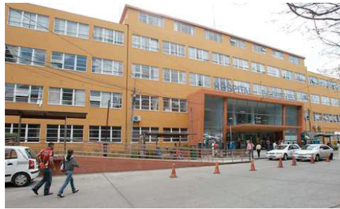
Figura 7: Hospital Roosevelt hoy en día. Fuente: http://static2.todanoticia.com (Abril 2017)

A partir de su inauguración en el año de 1955, el crecimiento de la afluencia del hospital ha ido avanzando, originando con ello la improvisación de lugares en donde se vendan alimentos, áreas de parqueo y de espera de pacientes no apropiadas y dañando con ello las áreas verdes existentes.