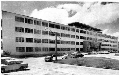
Figura 6: Hospital Roosevelt 1955. Fuente: http://d3ustg7s7bf7i9.cloudfront.net (Abril 2017)

Además de conservar su fachada original conserva el amplio espacio en su área de ingreso el cual ha cambiado en su utilización como se parecía en las Figuras 6 y 7. Al realizar un análisis de la Figura urbana del Hospital Roosevelt, se puede observar que se conjugan los elementos construidos y los elementos naturales. A través de los años la afluencia de los usuarios se ha ido transformando, ya que muchas personas del interior del país que no cuentan con la infraestructura médica suficiente se acercan al hospital en busca de atención médica, laboratorios y rayos x. todo esto ha hecho que el entorno del mismo se convierta en un área extremadamente concurrida.