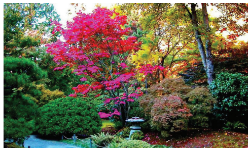
Figura 12: Jardín de Sensaciones.

Y son estos últimos el objetivo de este trabajo, como una opción para su integración a los hospitales públicos de Guatemala, ya que se diseñan para exaltar los cinco sentidos o alguno de ellos, y pueden ser ubicados en tanto en espacios amplios como en espacios reducidos.