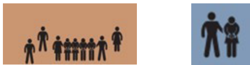
Ilustración 1. Nivel de organización de los tratantes