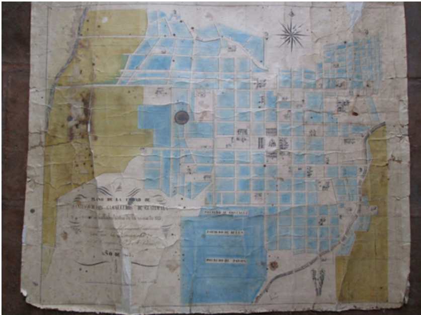
Figura 5: plano de la ciudad de Santiago de Guatemala, antes del terremoto de 1773. Copia del original de 1856.

Estos documentos nos muestran parte del desarrollo de la ciudad después de su destrucción en 1773. Nos revelan que hay mucho por descubrir, pero para ello es importante la intervención de archiveros comprometidos con el rescate del archivo.