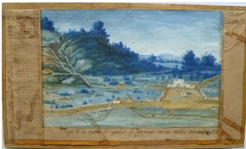
Figura 7: plano del acueducto de Pamputic, 1840, José Muñoz. Archivo Histórico Municipal de La Antigua Guatemala.