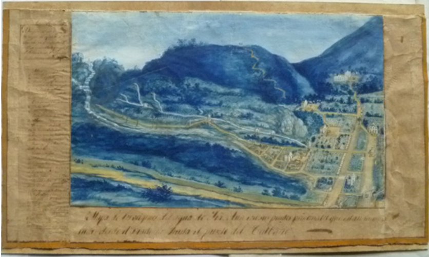
Figura 8: plano de acueducto de Santa Ana, 1840, José Muñoz. Archivo Histórico Municipal de La Antigua Guatemala.