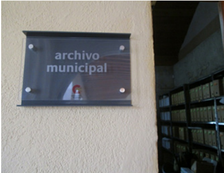
Figura 2: Archivo Histórico Municipal de La Antigua Guatemala. Fotografía de A. Arriola.