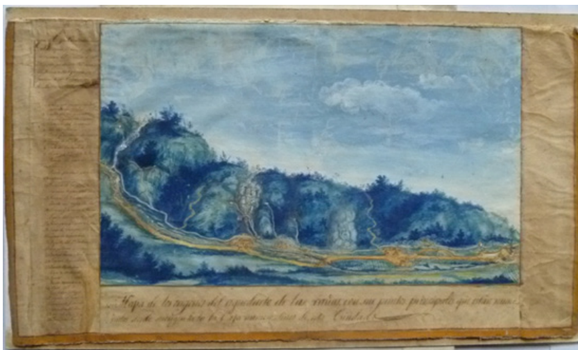
Figura 6: plano del acueducto de las Cañas, 1840, José Muñoz. Archivo Histórico Municipal de La Antigua Guatemala.