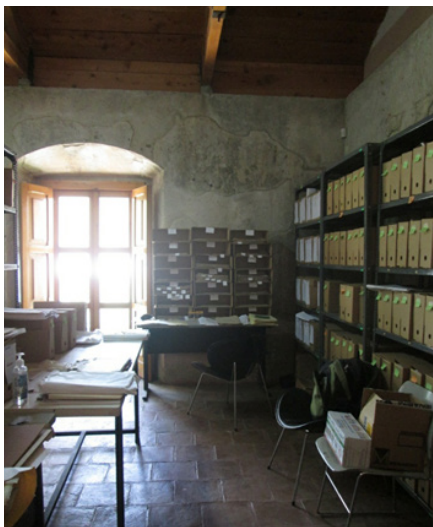
Figura 4: proceso de organización documental en el Archivo Histórico Municipal de Antigua Guatemala.