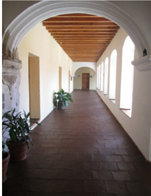
Figura 1: tercer claustro de la antigua Compañía de Jesús.

han sido los propios ciudadanos quienes han manifestado su preocupación en la conservación de los documentos. Este es el caso del Archivo Municipal Histórico de La Antigua Guatemala.