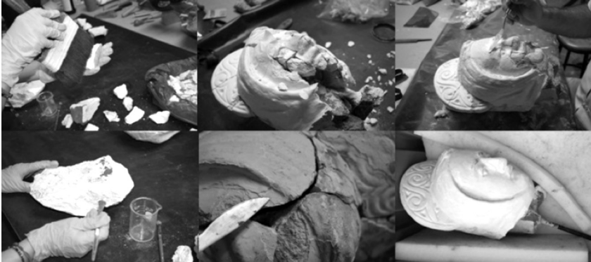
Figura 4: proceso de restauración de los fragmentos de la cabeza de la escultura de santa María de Cervelló.

faltantes estéticos del rostro; proporción de la mezcla 1/8 de cemento gris, 1/8 de cemento blanco y 50 ml de legía de hidratación de cal. Por último se efectuó el pulido y nivelación en la reposición de faltantes y se integró una capa pictórica de pintura a base de cal; proporción 1 de cal horcalsa y 1/8 de pegamento. Al haber fracturado el ladrillo de soporte de la cabeza con el cuerpo, se integró un pin de varilla de hierro roscado de \text{Ø } \frac{1}{2} " adherida con arena blanca, cemento gris y cemento blanco (ver figura 4).