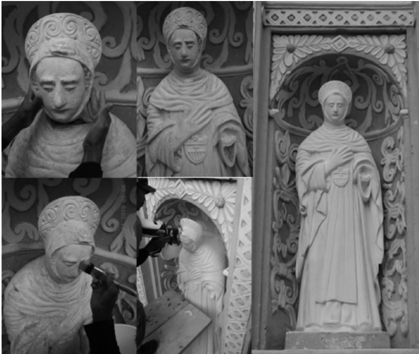
Figura 5: proceso de reintegración de la cabeza de santa María de Cervelló en fachada retablo del templo de la Merced.

Es de destacar que el financiamiento para la restauración de la cabeza de la escultura fue asumida por el CNPAG en colaboración con la iglesia de la orden mercedaria, quien donó el adhesivo epóxico.