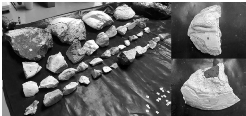
Figura 3: fragmentos recuperados de la escultura de santa María de Cervelló.

El presente artículo se enfoca en el análisis de la morfología de cada fragmento de la cabeza de la escultura de santa María de Cervelló; con el objetivo de establecer el procedimiento para recuperar la volumetría del rostro destruido, por medio de una propuesta de restauración que permita la conservación de la escultura integral en su sitio original.