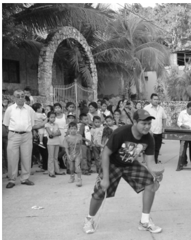
Figura 11: encargado de atraer y guiar al cerdo, en una mano trae una especie de sonaja, hecha con la mitad de una jícara que dentro lleva maíz y que está envuelta con un pañuelo amarrada a la muñeca. Fotografía por G. Luna, 2016.