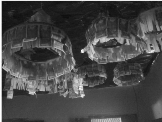
Figura 3: vista de las ruedas de dinero, que cuelgan del techo del salón en donde se realiza el novenario. Fotografía por G. Luna, 2016.

Al terminar el novenario, estas ruedas de dinero son tomadas por las personas asistentes que tengan alguna necesidad económica, con la salvedad de que la misma rueda será devuelta el próximo año con el doble de la cantidad de dinero tomada. Este dinero recaudado es utilizado para los gastos que implican la celebración, como las meriendas diarias, la compra de las flores, la compra del cerdo y su preparación, cohетillos, decoración del altar, el pago de la marimba y todos los gastos que la celebración amerite.