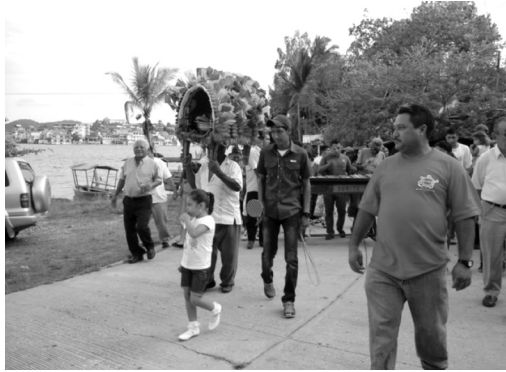
Figura 7: inicio del tradicional “baile de la cabeza de coche”, en la aldea de San Miguel, Flores, Petén.

Las danzas son sin duda alguna una muestra de la máxima expresión realizada por el hombre, ya que durante la ejecución del mismo se plasman emociones y sentimientos. Cuando la cabeza del cerdo termina de ser preparada y la jaula decorada, a eso de las 3 de la tarde, inicia el recorrido. El estruendoso ruido de las bombas anuncia que el baile ha iniciado, las personas de la aldea y los visitantes empiezan a reunirse en la calle principal, cerca del lago.