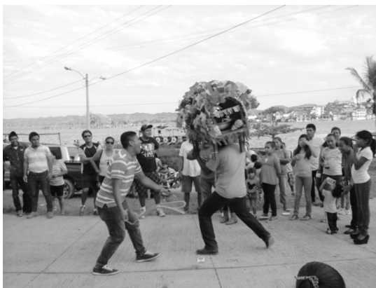
Figura 9: momento en el cual la cabeza de coche es bailada. Fotografía por G. Luna, 2016.

Todo aquel que desee agregarse a la celebración puede acompañar a los bailadores o simplemente salir de su casa para ver el baile. Durante toda la ejecución del baile se lanzan cuetes que sirven para llamar e invitar a la población a reunirse. En todo el recorrido que dura 2 horas aproximadamente, las notas musicales de la marimba entonan distintas melodías que alegran a los participantes y observadores que, exaltados de alegría, disfrutan de la actividad.