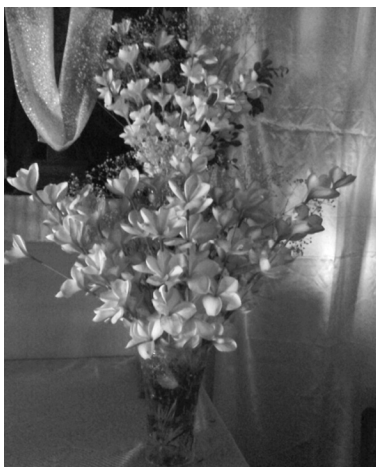
Figura 2: flores de mayo enhiladas en los chives.

El proceso de enhilar, como lo llaman los lugareños, es arduo, meticuloso y de mucha paciencia, y durante los nueve días que dura el rezo es realizado diariamente, pues la flor dura viva solamente 24 horas, y el altar a la Santísima Trinidad debe estar decorado con flores frescas, razón por la cual las mujeres participantes inician a enhilar desde las 10 de la mañana, para que a las 5 de la tarde, que da inicio el rezo, el altar esté perfectamente decorado.