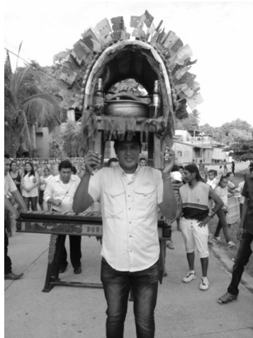
Figura 10: vista del uno de los cargadores y participantes al baile.

Tiene el papel central del baile y de llevar, sobre su propia cabeza, la pesada cabeza del cerdo con sus respectivos adornos y las botellas de agua ardiente que van amarradas a la jaula, para evitar que se caigan durante el baile, ya que el mismo es ejecutado con movimientos rápidos. El papel del cargador es el más importante, ya que este representa al cerdo, que es arreado, para ser atrapado previo a su muerte.