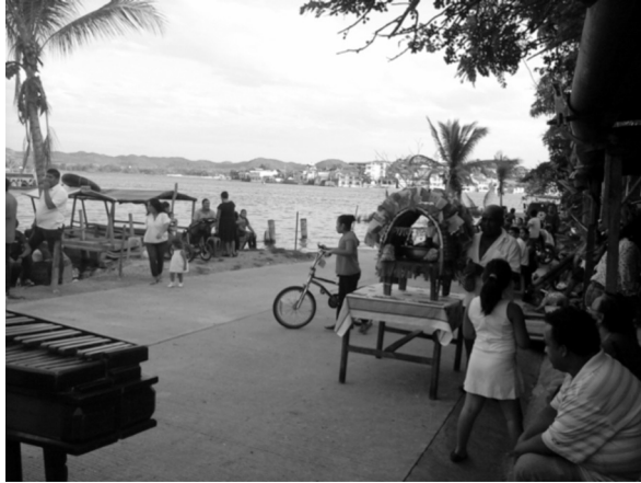
Figura 12: cuando la celebración culmina, los participantes se preparan a degustar de un bollo con totoposte, y principalmente a esperar su pequeño panecillo con un pedazo de la cabeza del cerdo, esperando que la ofrenda haya sido recibida.