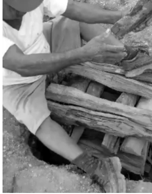
Figura 4: momento en que entierra la cabeza de cerdo. Fotografía por Enrique Mis Peche, 2014.

Para enterrar la cabeza del cerdo se escoge una parte alta de la aldea, mientras esto ocurre, en marimba se ejecuta la melodía Bajo el ceibo murió Tupuyen . en idioma Maya Itzá, tupuyen significa cerdo. En el tiempo que dura el entierro, los participantes de la actividad celebran con bailes, comida y bebida alrededor de la cabeza enterrada, celebración que se extiende hasta altas horas de la noche.