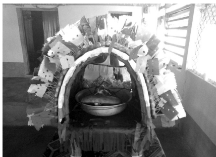
Figura 6: cabeza de coche lista para la ejecución de baile. La fotografía muestra la cabeza, dentro de su jaula o corral, decorada por bambalinas y banderitas de vistosos colores, dispuestas sobre los 260 panecillos.

Entre las actividades preparatorias, previo al baile, la familia Peche en conjunto con algunos participantes elabora una especie de jaula arqueada, tejida de madera y bejucos, dispuesta sobre una pequeña mesa. Ambos elementos simbolizan el corral en donde se encierra al cerdo, y son adornados con papeles multicolores, además, alrededor de toda la jaula son colocados los bizcochos con las banderitas. En el interior y al centro de la jaula es colocada la cabeza del cerdo, acompañada de botellas de agua ardiente y dulces que serán repartidos durante todo el recorrido mientras es bailada.