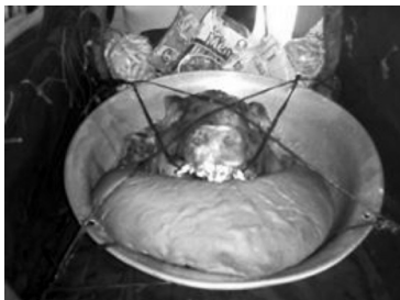
Figura 5: imagen de la cabeza de cerdo, durante su preparación.

cerdo es incluido un enorme pan blanco, conocido generalmente en Guatemala como pan francés. El resto del cuerpo del cerdo es utilizado para la realización de los bollos (tamales de maíz), mismos que se dan al finalizar la celebración.