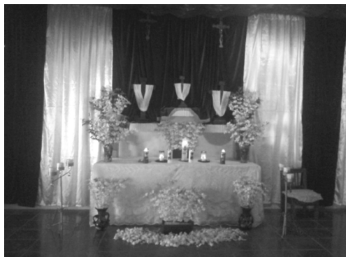
Figura 1: vista del altar decorado con flores de mayo y las tres cruces vestidas que representan a la Santísima Trinidad, en el extremo derecho de la fotografía se puede observar la silla en donde se ubica la rezadora. Fotografía por G. Luna, 2016.

El proceso de enhilar, como lo llaman los lugareños, es arduo, meticuloso y de mucha paciencia, y durante los nueve días que dura el rezo es realizado diariamente, pues la flor dura viva solamente 24 horas, y el altar a la Santísima Trinidad debe estar decorado con flores frescas, razón por la cual las mujeres participantes inician a enhilar desde las 10 de la mañana, para que a las 5 de la tarde, que da inicio el rezo, el altar esté perfectamente decorado.