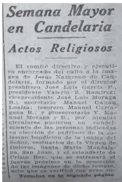
Figura 3: detalle de la invitación a la ceremonia de bendición del estandarte de Cristo Rey, para la Semana Santa de 1928. El Imparcial , 3 de abril de 1928, portada

Según se ha podido investigar, este alto prelado compartió sus experiencias en torno al conflicto Iglesia-Estado en su nación. Como particular detalle, todo este evento religioso estuvo centrado bajo la advocación de Cristo Rey y, por ende, la imagen de Jesús Nazareno de Candelaria jugó un papel principal, siendo nuevamente el centro de veneración y posicionamiento por parte de la Iglesia católica en la sociedad guatemalteca, para establecer la importancia del catolicismo y del Nazareno como un referente de cohesión social en el siglo XX. ( El Nazareno , 1929, núm. 272)