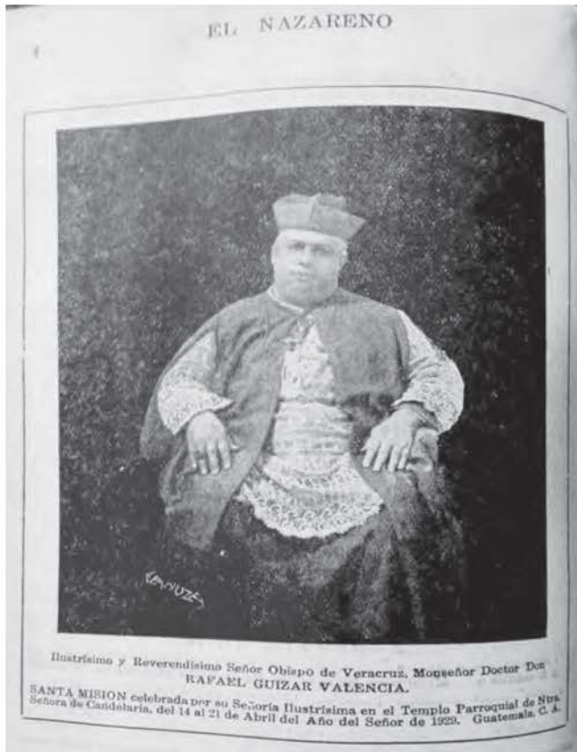
Figura 10: monseñor Rafael Valencia obispo mexicano que celebro en 1929 la Santa Misión una actividad de la iglesia católica enfocada en recobrar el espacio perdido, desde la reforma liberal en 1871 en la sociedad, así como para fomentar la devoción a la advocación de Cristo Rey en la parroquia de Candelaria El Nazareno, 1929 numero 272