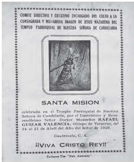
Figura 5: panfleto elaborado en la imprenta San Antonio de la ciudad de Guatemala, en este mismo taller se realizaba la impresión del Semanario El Nazareno. Nótese la invitación a la santa misión de 1929, la cual se dedica a Cristo Rey, teniendo especial presencia la imagen del Nazareno de Candelaria

Estos datos demuestran cómo se logró, desde 1927 hasta 1930, institucionalizar esta festividad. Como dato curioso, cabe mencionar que para hacerla aún más solemne y lograr tener un mayor arrastre y presencia en la sociedad de la época, la celebración comenzaba desde la medianoche del día anterior con alegres convites, para concluir a la medianoche del día siguiente, teniendo como principal atractivo las bombas y marimbas, así como la iluminación eléctrica de la época, lo cual hacía que el pueblo se congregara. Además, se tiene evidencia documental de que para el cierre de esta festividad la noche del domingo se realizaba un cortejo por las calles del barrio con el Nazareno de Candelaria. Este dato no solo interesa para la historia de la escultura, sino para demostrar el poder de presencia en la sociedad de este tipo de devociones y su antigüedad, las cuales se remontan al siglo XVI, cuando llegaron a estas tierras con los misioneros católicos que ayudaron en la evangelización.