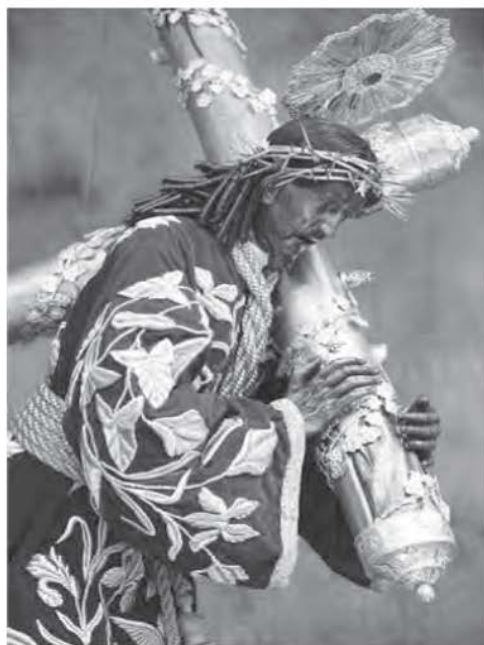
Figura 9: escultura de Jesús Nazareno de Candelaria, obra de la imaginería colonial guatemalteca, con la que se estableció, en 1927, la festividad de Cristo Rey en toda la República de Guatemala, para cumplir con las directrices del papa Pío XI

Archivo Asociación de Devotos Cargadores de Jesús Nazareno de Candelaria