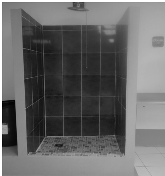
Figura 1. Construcción de ducha de seguridad cumpliendo con requisitos del Informe 32.

Se establecieron procedimientos e instrucciones de trabajo para el uso correcto de cada equipo de seguridad industrial.