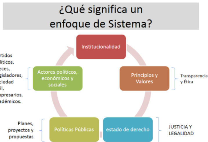
Gráfica 1. Elaboración propia.

Esta institucionalidad, pareciera ser entendida fácilmente, pero requiere fundamentalmente de teorías, principios y determinación de conductas sociales (morales y éticas). Así entonces, el primer gran paso para contar con una institucionalidad sólida, y por ende con un Estado fortalecido, es el entendimiento de toda la población de los principios y valores que les inspira. La sociedad, que genera moralidad y comportamientos sociales claros, los traslada a la institucionalidad del Estado, lo que hace que éstas sean transparentes y eficientes. El recurso humano debe entonces, responder a esa aplicación formal, con el objetivo determinado de la reducción de desigualdades y la construcción de oportunidades equitativamente.