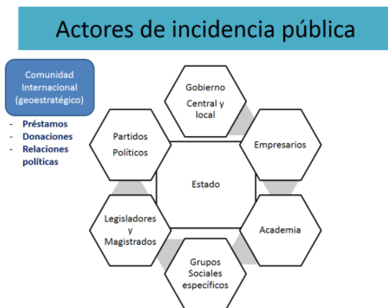
Gráfica 4. Elaboración propia.

incidencia pública dentro de un Estado, permite la consecución de una política exterior colaborativa en las relaciones internacionales, en una etapa del mundo donde los aliados y amigos internacionales son obligatorios, y sin pensar en tan siquiera un rechazo formal de sus propuestas. La comunidad internacional, para países en vías de desarrollo, durante muchos años ha financiado acciones para alcanzar el desarrollo, por la vía de donaciones o bien préstamos, que han sustituido la labor del Estado de recaudar para su propio beneficio y el de sus habitantes.