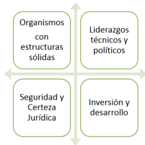
Gráfica 2. Elaboración propia.

Al momento de contar con una Institucionalidad basada en principios y valores sociales determinadas por la población, así como con un marco de legalidad efectivamente cumplido, y en caso de no serlo, sancionado (atacando la impunidad); se requieren métodos técnicos y políticos para lograr su crecimiento y desarrollo a todo nivel. Para ello, las políticas públicas son indispensables, y contar con los planes, proyectos y propuestas es fundamental. Las políticas públicas son el instrumento perfecto en todo estándar internacional, para alcanzar un desarrollo formal de los países, atendiendo a sus propias realidades y necesidades. Por ello es que una fórmula específica no puede copiarse o duplicarse, sino debe construirse con apoyo de los actores sociales de forma integral.