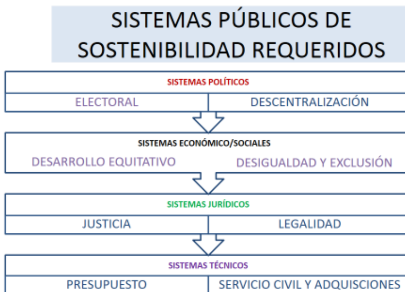
Gráfica 5. Elaboración propia.

Estos sistemas que hacen sostenible al Estado, en sus ejes sistémicos, carecen en gran parte de estos territorios centroamericanos de un fortalecimiento y de una coherencia de actuación en favor de sus sociedades. Por ello se hace indispensable trazar rutas de seguimiento, para que en los momentos complejos, se pueda retomar circunstancias fundamentales y continuar con la disciplina directa que genere resultados.