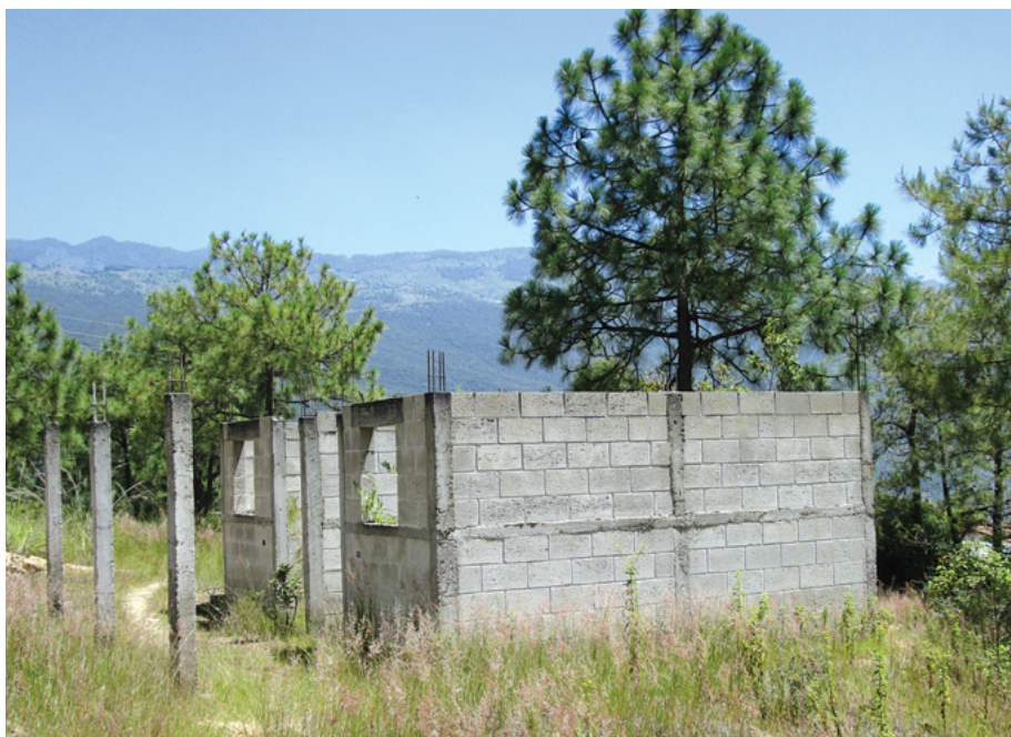
Fotos 9 y 10. Vivienda de un proyecto habitacional del gobierno y vivienda financiada con remesas