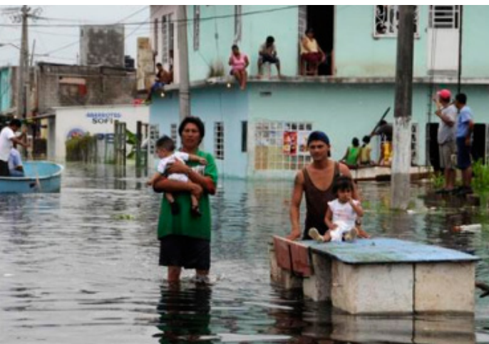
Foto: Migración y cambio climático