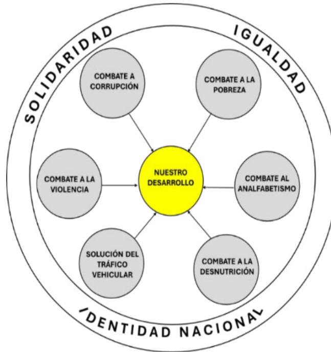
Figura No. 1 ESQUEMA DE ABORDAJE

Con este diseño en mente entonces, se podrán iniciar los elementos pertinentes para el logro de resultados que nos satisfagan a todos los guatemaltecos. Para eso, describimos la forma de abordarlos, expuestos a continuación: