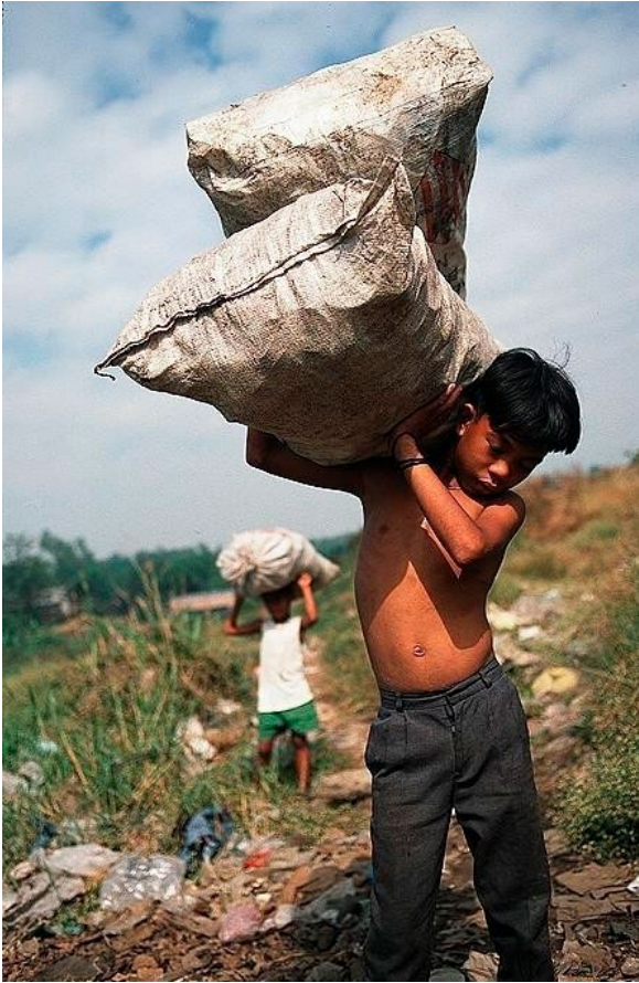
Niños menores de 14 años trabajan en la finca de caña de azúcar de Otto Kuhsiek, presidente de la Cámara del Agro.

Medios locales y trabajadores refieren casos de personas fallecidas por intoxicación de estos analgésicos. No pueden desempeñarse sin el consumo de los mismos, y tienen la costumbre de purgarse cada tres meses para desintoxicar su organismo. Describieron que solamente el domingo no consumen dichas sustancias. Ese día no cuentan con ánimo para desarrollar ningún tipo de actividad, física, social o familiar. Se dedican a dormir para recuperar energías.