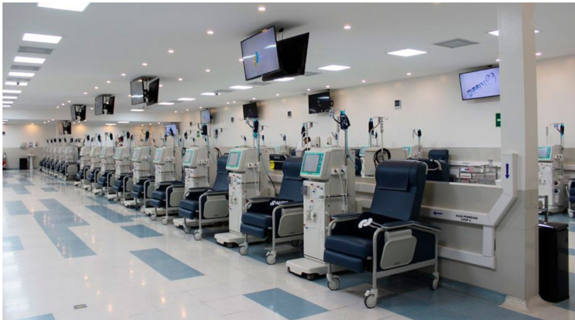
Unidad de hemodiálisis en Escuintla (2020).

Para comprender las implicaciones sociales que ocasiona la enfermedad en los pacientes diagnosticados, se redactaron definiciones y las causas asociadas a su desarrollo, así como los procesos que enfrentan al ser atendidos. Al estudiar las implicaciones sociales que afrontan, se compararon las experiencias recabadas por los profesionales. En los casos se asociaron de manera cruda las condiciones que presentan estas personas. La evidencia permitió realizar una interpretación en el análisis de los resultados obtenidos.