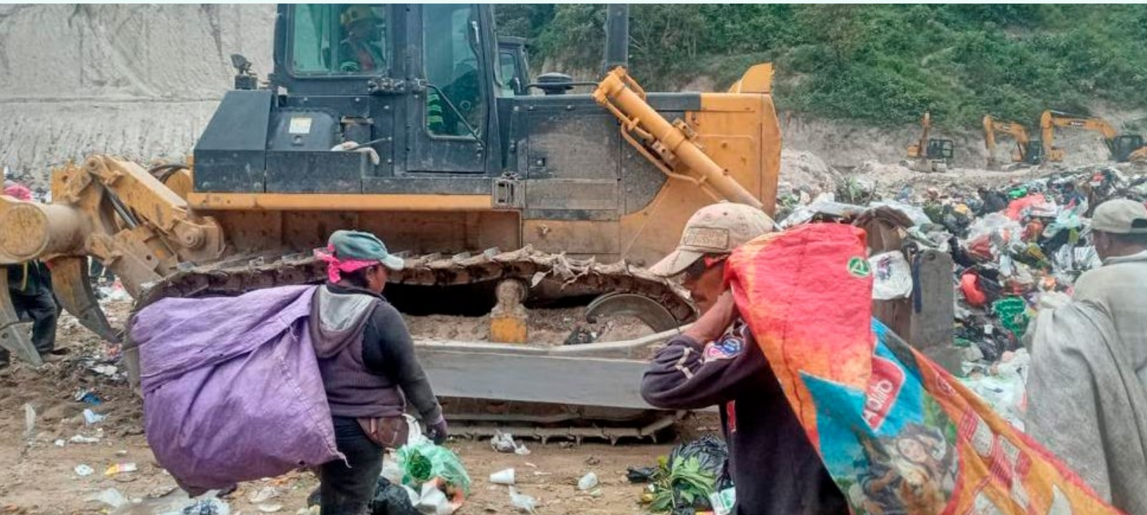
Los recuperadores peones, una casta de las tres tribus que habitan el vertedero.