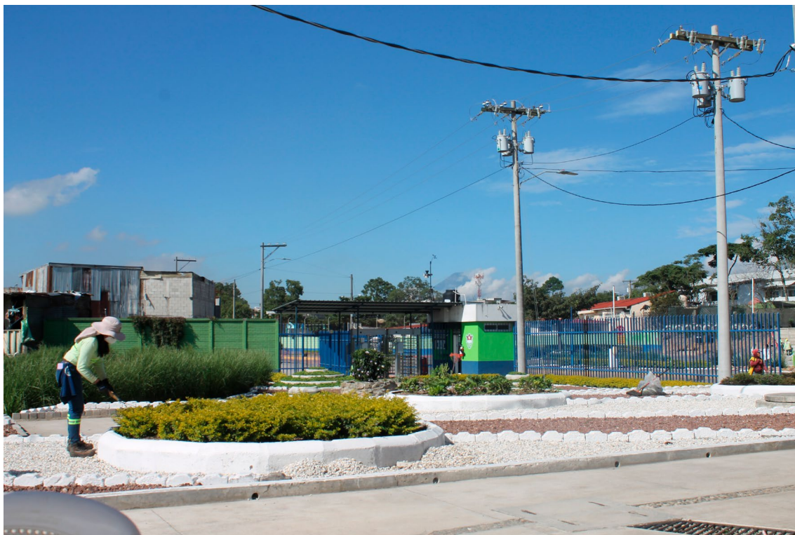
La entrada al proyecto denota una nueva faceta, menos deprimente a la conocida antiguamente y otros vertederos centroamericanos de poco control de acceso.

Adicionalmente, se indagó y observó las proyecciones y las acciones de planificación de proyectos que se tienen para las partes contiguas que continúan siendo el centro de disposición final de desechos utilizado incluso por 14 municipalidades metropolitanas que poco aportan, en