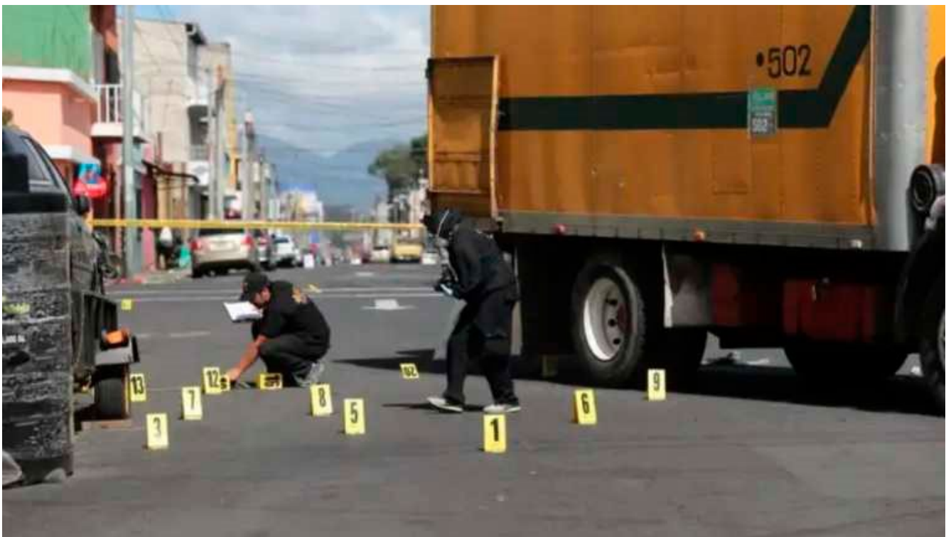
En la fotografía se observa la saña empleada en contra de recolectores de basura por los grupos criminales, cuando incumplen el pago de la extorsión. (Fotografía de Prensa Libre: Hemeroteca PL, 2022).

significativamente el control en áreas urbanas, especialmente en la zona metropolitana y en departamentos y municipios del país afectando a diferentes estratos sociales; los recolectores de basura son uno de estos sectores que son acosados por lo pandilleros. El dinero obtenido ilícitamente por la extorsión es la principal fuente de ingresos para estas organizaciones criminales.