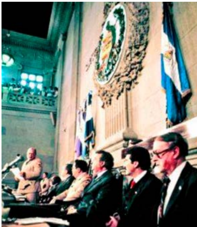
Instalación de la Asamblea Nacional Constituyente.

Otro de los artículos que acaparó la atención de los constituyentes es el relacionado con la «Pena de muerte», aprobado como enmienda por sustitución total al Artículo 17 a , el cual se convirtió en el Artículo 18: