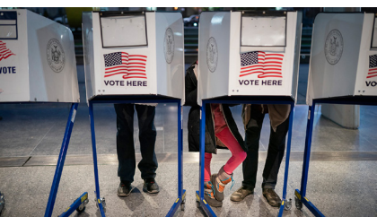
Foto: Elección de Estados Unidos

Debemos tener en cuenta que tal reunión se desarrolla en momentos de votación de medio término para elegir representantes del Senado y del Congreso de los Estados Unidos y varios gobernadores estatales, lo que tiene influencia no solo en el cambio climático futuro sino en la geopolítica internacional. Ahora bien, todo apunta a que esta es una cumbre climática pequeña, no decisiva y, por lo tanto, con pocos logros a obtenerse: ni China ni India, como tampoco Estados Unidos enviaron representantes de la cúspide del Olimpo de las decisiones mundiales.