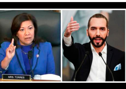
Foto: Norma Torres y Nayib Bukele

Es de resaltar la revalidación de Norma Torres, quien fue altamente atacada por diversos grupos republicanos y por el propio presidente Nayib Bukele, quien instó a sus connacionales migrantes a no votar por la candidata Demócrata, quien ha sido crítica de los regímenes centroamericanos de tendencia dictatorial.