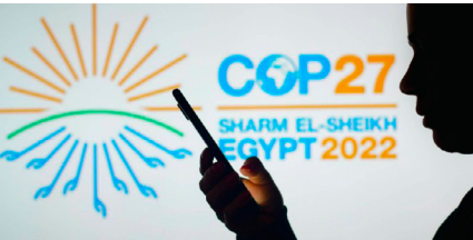
Foto: Cumbre climática

Se requiere así de una oposición contundente hacia los combustibles fósiles, que, dicho sea de paso, hoy en día anda rondando por arriba de los 90 dólares el barril Brent de petróleo, teniendo ello un impacto de primer orden en la actual escalada inflacionaria global.