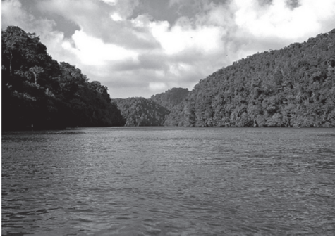
Figura 5. Godínez R. Cañón del Río Dulce, agosto 2005, Entrada al cañón desde el Golfete

Clase A: el paisaje es de calidad alta , áreas con rasgos singulares y sobresalientes (de 19 a 35 puntos). En zonas lagunares se puede observar este tipo de paisaje menos abierto (Punta de Manabique en la costa atlántica y en el canal de Chiquimulilla en la costa del Pacífico pero a menor escala).