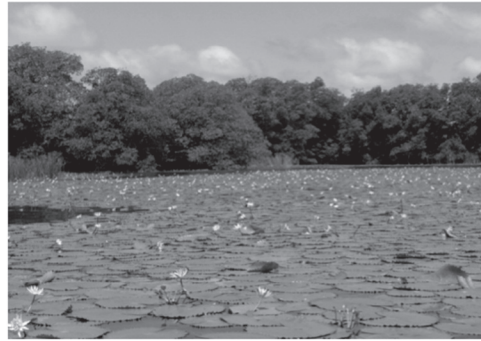
Figura 2. Godínez R. Golfete, Río Dulce, agosto 2005, Biotopo Chocón Machacas 7

riencia y visita e campo complementan la descripción analítica de la misma. Los análisis nocturnos se realizan cuando se cuenta con buena iluminación como es el caso de ciudades y centro poblados. Al tener un amplio número de fotografías se debe utilizar la de mejor resolución y la que cuente con una mayor amplitud escénica, no siendo necesaria una vista aérea.