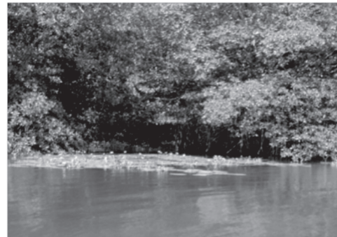
Figuras 3 y 4 Godínez R Golfete Río Dulce agosto 2005, Biotopo Chocón Machacas