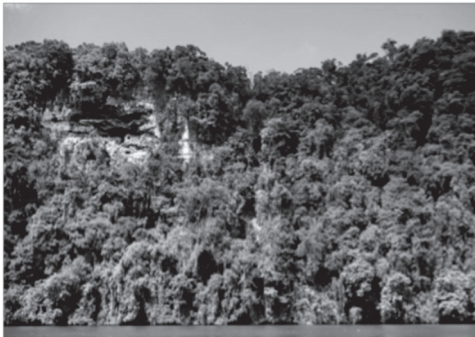
Figuras 6 y 7. Godínez R. Cañón del Río Dulce, agosto 2005, acantilados y cueva de la Vaca

Análisis Visual: Al describir los componentes abióticos presentes de la fotografía se indica la importancia en la configuración del paisaje.