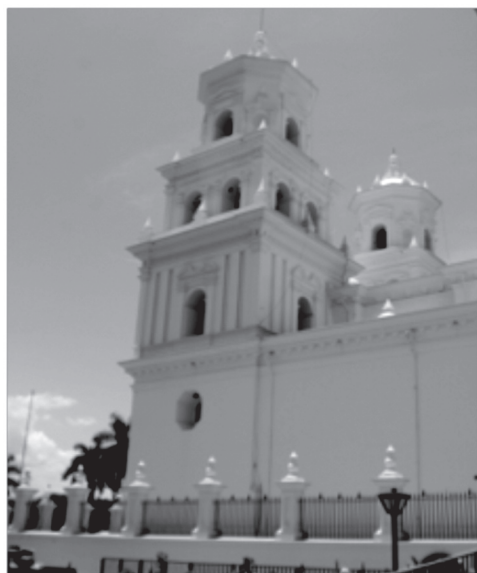
Figura 3 Vista del campanario poniente del Calvario de Esquipulas, la actual Basílica del Cristo Negro.

Digitalizado por M. Ubico según Propuesta de Plan Maestro La Antigua Guatemala. Universidad de Las Palmas de la Gran Canaria, Gobierno de Canarias. Copia en Sección de Registro del Consejo Nacional para la Protección de La Antigua Guatemala. 2010