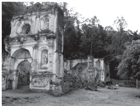
Figura 1 Ermita de N.S. de Dolores del Cerro, La Antigua Guatemala.

Desde inicios del siglo XVIII había “otro Calvario” en la Capital del Reino, la vía sacra se desarrollaba entre las ermitas de N.S. de Dolores del Cerro y Dolores del Llano, allí los dominicos practicaban el viacrucis los viernes de Cuaresma y en Semana Santa. 6 En la Figura 1 adjunta es posible observar los vestigios de este templo.