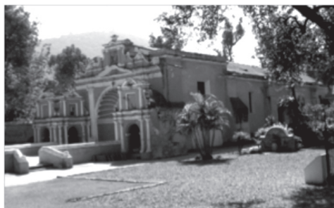
Figura 5. Vista del frente y costado poniente del templo del Calvario, La Antigua Guatemala.