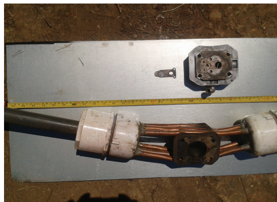
Figura 5 Cabeza del compresor de aire modificada con tubos de cobre por donde pasa agua para enfriarla.

De la salida de la columna de secado, el biogás entra al compresor de aire cuya cabeza fue modificada para dispersar el calor utilizando la misma agua que lava el biogás (Figura 5). El biogás se comprime hasta 830 kPa y se almacena en el compresor que cuenta con un filtro en su salida para atrapar trazas de aceite para que no contaminen los recipientes donde se transfiere el biogás. El compresor fue previamente purgado con nitrógeno para disminuir el riesgo de explosión.