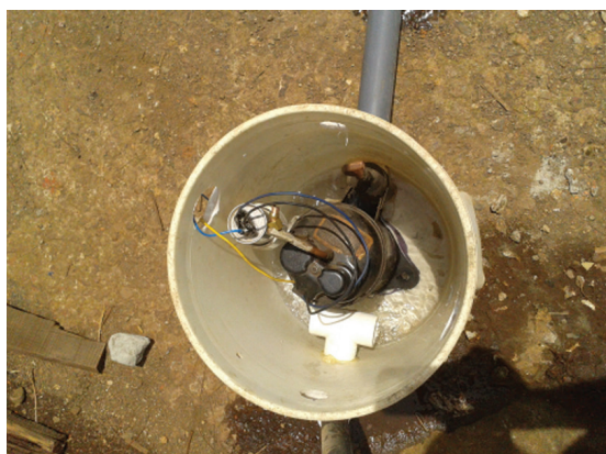
Figura 4. Compresor de refrigeración usado para inyectar el biogás a la columna de purificación.

lavado de biogás, esto permite aumentar su eficiencia y a la vez acelera la eliminación del \text{CO}_2 del agua antes de ser rociada dentro de dos tambores de metal oxidados. El óxido de hierro dentro de los tambores, ayuda a la eliminación del \text{H}_2\text{S} pues este precipita como sulfuro de hierro. Los flujos de agua y biogás pueden ser regulados y se ajustaron a 25 L/min. para el agua y 20 L/min. para el biogás. Una vez lavado, el biogás pasa por una columna de secado de 134 cm de alto por 7,5 de ancho llena con 2 kg de óxido de calcio sin pulverizar y 1 kg de carbón vegetal, estos eliminan la humedad del biogás y la mayoría de los contaminantes remanentes. Bajo estas condiciones, la presión del biogás dentro del sistema alcanza 200 kPa.