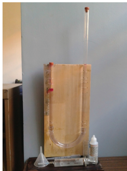
Figura 6 Equipo para medir la pureza del biogás.

La composición inicial del biogás la realizó un ente externo que empleó un cromatógrafo de gases con detector de conductividad térmica. Ese valor fue el que se utilizó para verificar la reproducibilidad con el equipo volumétrico que aparece en la Figura 6. El método volumétrico tiende a sobreestimar la cantidad de metano en un 3 % debido a que el nitrógeno e hidrógeno presentes en el biogás no son solubles en NaOH y se suman a la lectura de metano.